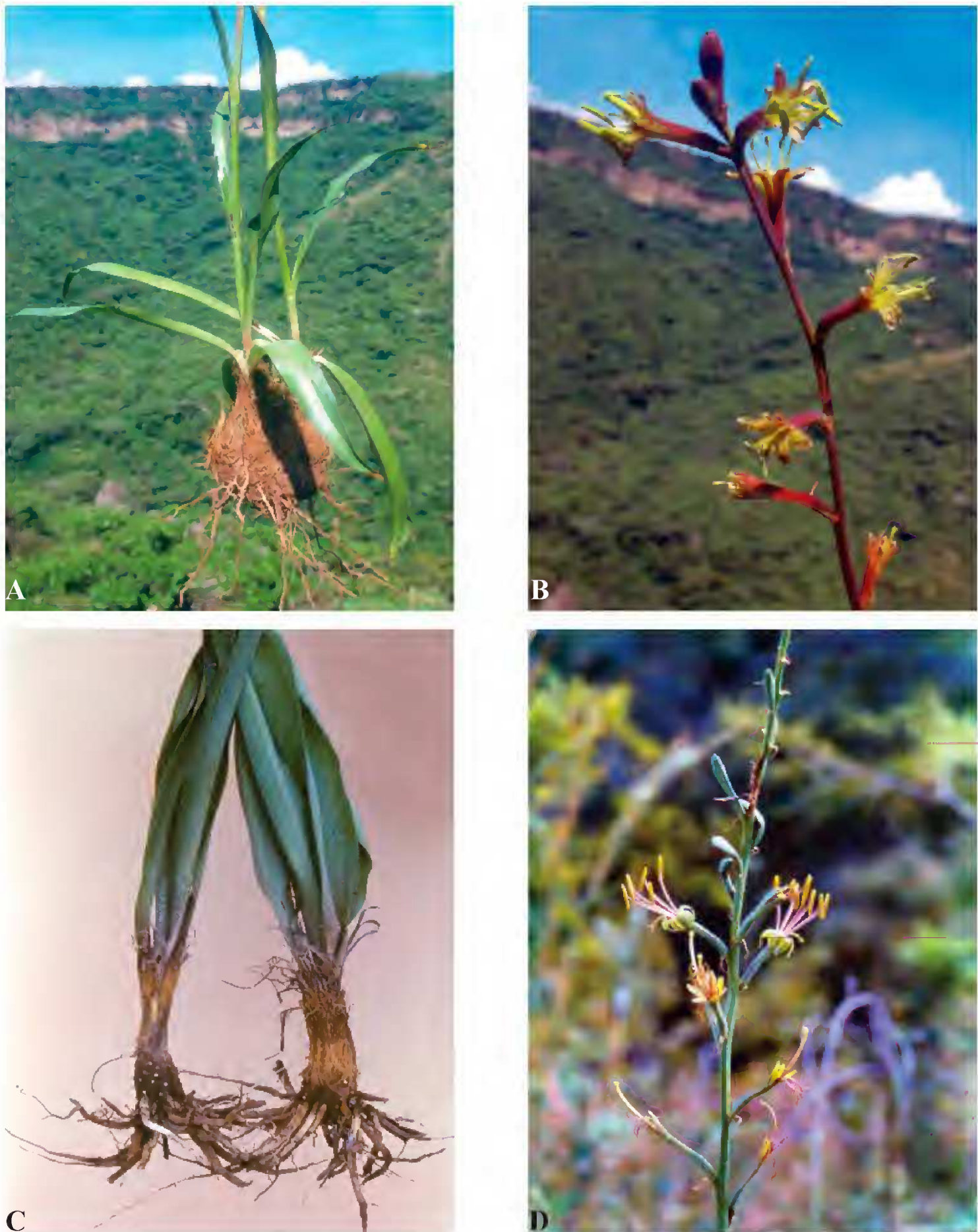
Fig. 3. A y B. Manfreda galvaniae : A. Cormos y hojas; B. Inflorescencia. C. Cormos de M. scabra (izquierda) y M. galvaniae (derecha); D. Inflorescencia de M. scabra . (A y B, del número AG-6624; C izquierda y D, del número AG-6084; C derecha, del número AG-6085. Todas las fotos de la barranca de Malinaltenango.